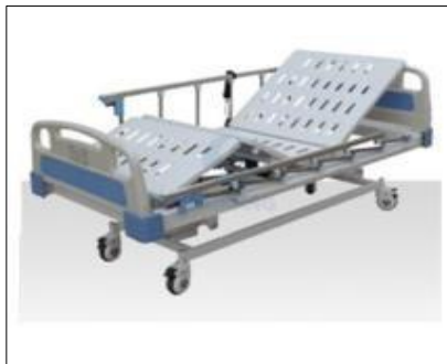
Acuerdo N° 11932/sesión extraordinaria 243- Consejo Regional de Coquimbo

Las ayudas técnicas permiten a las personas recuperar funcionalidad y realizar diferentes actividades de la vida, entre las ayudas técnicas se encuentran catres clínicos, bastones, andadores, sillas de ruedas, entre otros equipamientos.