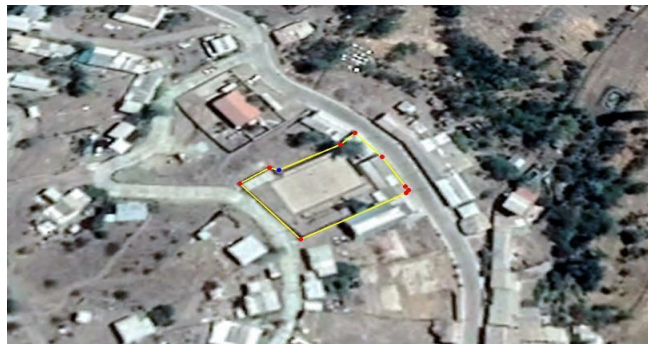
Foto Localización Centro Comunitario Acuerdo N° 11932/sesión extraordinaria 243-Consejo

El proyecto contempla la construcción de un centro comunitario en Cogoti 18 de 1.042,25 m 2 , conformado en dos niveles que considera salas y salón de reuniones, baños, hall de acceso, cocina, multicancha, bodega y camarines. Además de la adquisición de equipos y equipamientos. Con el objetivo de permitir el desarrollo correcto de las actividades sociales organizadas por las diferentes organizaciones comunitarias de la localidad de Cogotí 18.