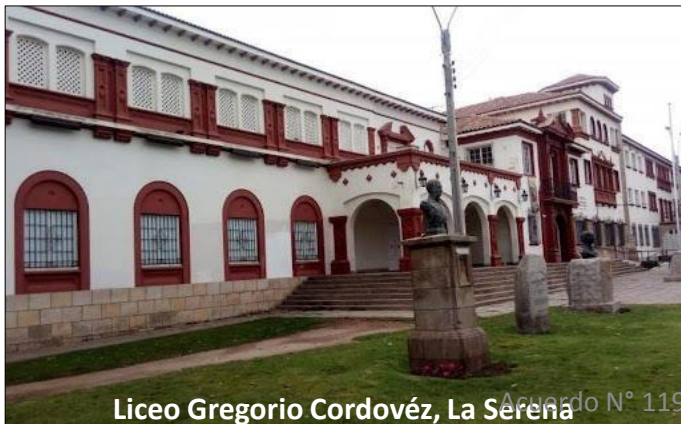
Liceo Gregorio Cordovéz, La Serena

Consiste en ejecutar obras de conservación de la infraestructura existente, con la finalidad de contar con un centro educacional en condiciones óptimas para la comunidad educativa. Las obras consisten en mejoramiento de salas y obras de pavimentación, reposición de iluminación y obras en patio interior y exterior.