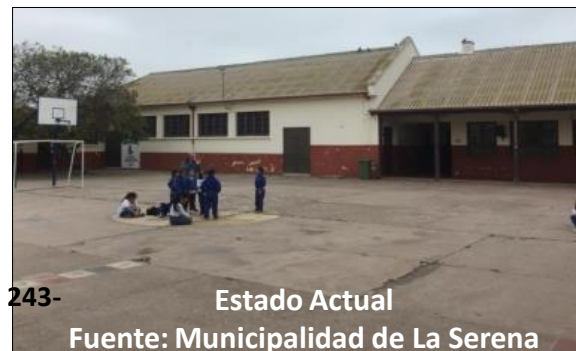
Estado Actual