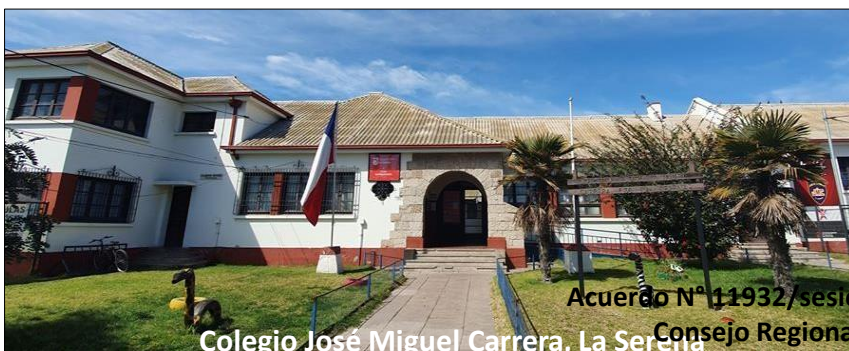
Acuerdo N° 11932/sesión extraordinaria 243- Consejo Regional de Coquimbo Colegio José Miguel Carrera, La Serena

El proyecto de conservación consiste en el reemplazo del asbesto cemento en la techumbre, cambio del tipo de ventanas, reposición de puertas de salas de clases, recintos administrativos y servicios higiénicos (SSH), conservación de la cancha deportiva y mejoramiento de los sectores comunes e instalación de pastelones y pasto sintético. La conservación de la infraestructura existente permitirá mejorar las condiciones estructurales del recinto educativo y espacios comunes, con el fin de incrementar el estándar y la calidad de la educación.