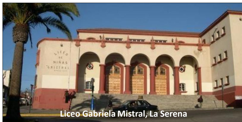
Liceo Gabriela Mistral, La Serena

Se contempla el mejoramiento de 36 recintos entre salas de clases, dos salones auditorios, los laboratorios de química y física, con un total de 1700 m2 directamente a intervenir. La conservación de la infraestructura existente del establecimiento, permitirá restablecer la capacidad instalada de 922 matrículas. Actualmente solo se pueden ofrecer 471 matrículas.