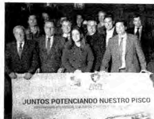
El gobierno actual retomó la mesa de trabajo que aborda la defensa del pisco y su promoción.