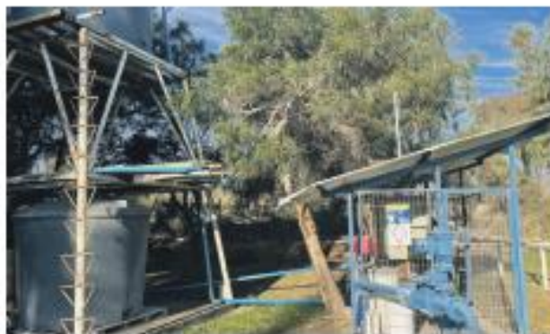
El pozo municipal en El Camping comienza a mostrar bajos niveles ante la extracción diaria de agua para surtir distintos APR de la zona.

¿Cuál ha sido la respuesta de los regantes y de las autoridades del STOP?