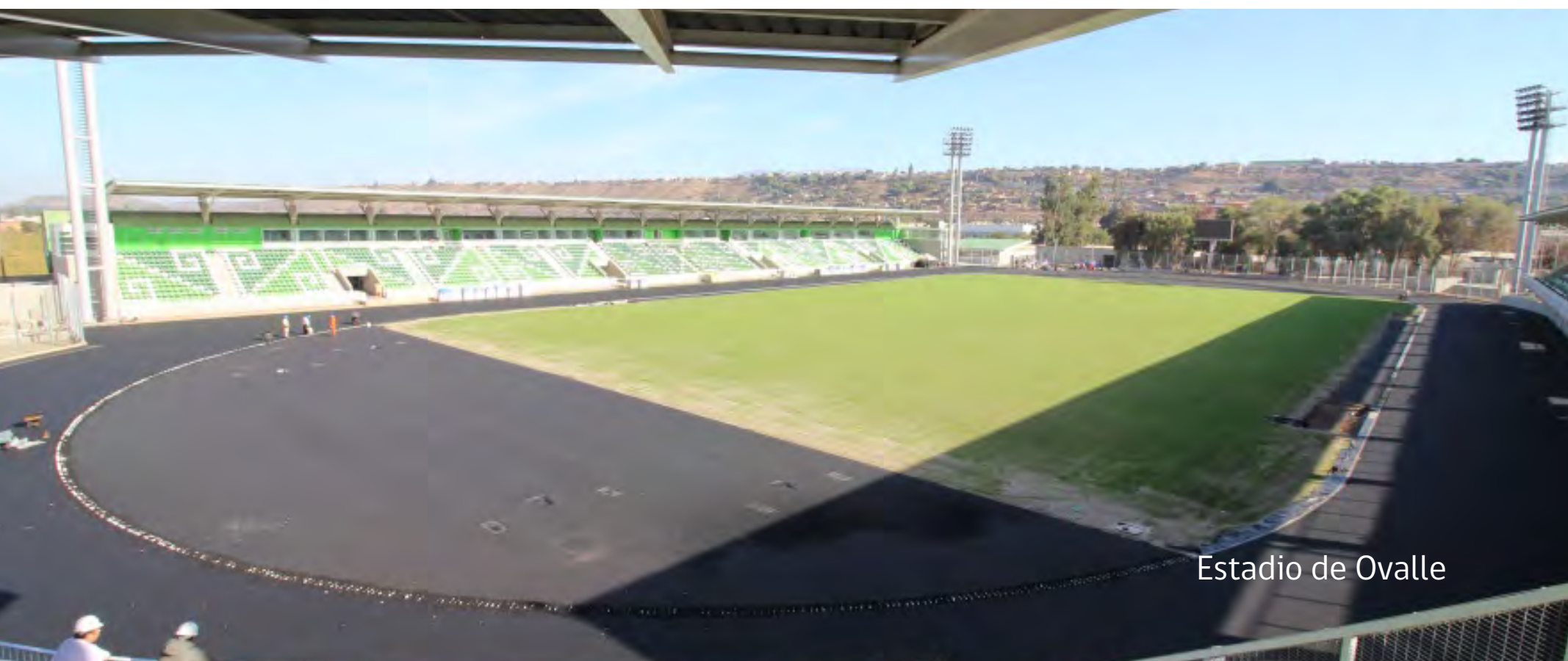
Estadio de Ovalle

Estadio de Ovalle / Estadio de Canela / Estadio de Combarbalá / Estadio de Vicuña Gimnasio de Andacollo / Gimnasio de Salamanca / Canchas de La Pampilla, Guanaqueros e Illapel