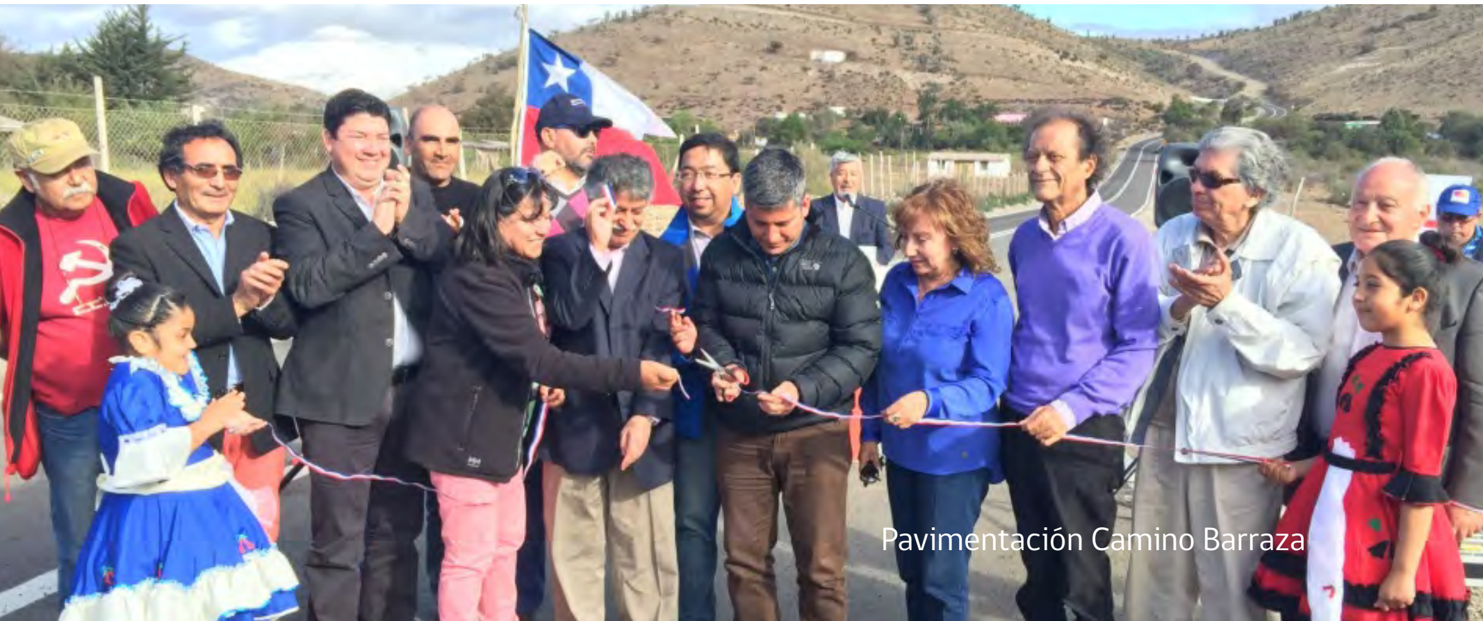
Pavimentación Camino Barraza

básicos rurales pavimentados en la región