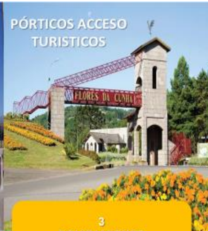
PÓRTICOS ACCESO TURISTICOS