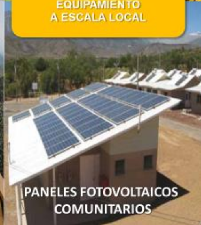
PANELES FOTOVOLTAICOS COMUNITARIOS