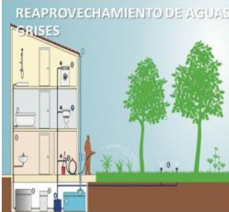
REAPROVECHAMIENTO DE AGUAS GRISES