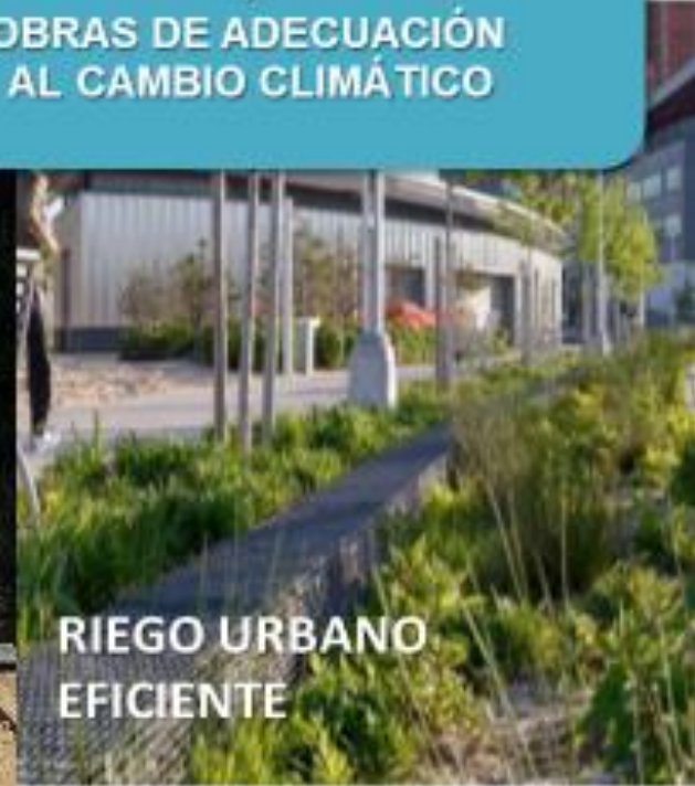
RIEGO URBANO EFICIENTE