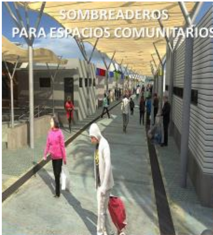
SOMBREADEROS PARA ESPACIOS COMUNITARIOS