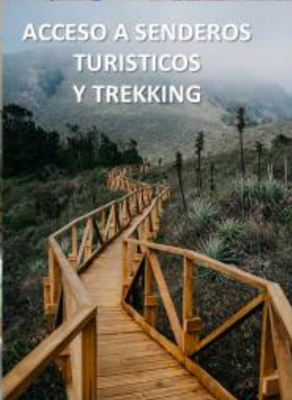
ACCESO A SENDEROS TURISTICOS Y TREKKING