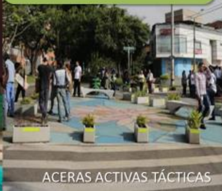
ACERAS ACTIVAS TÁCTICAS