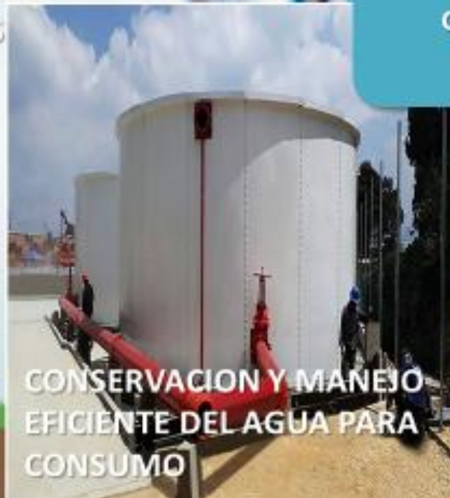
CONSERVACION Y MANEJO EFICIENTE DEL AGUA PARA CONSUMO