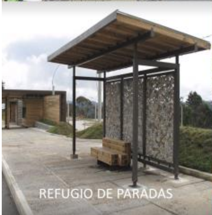
REFUGIO DE PARADAS