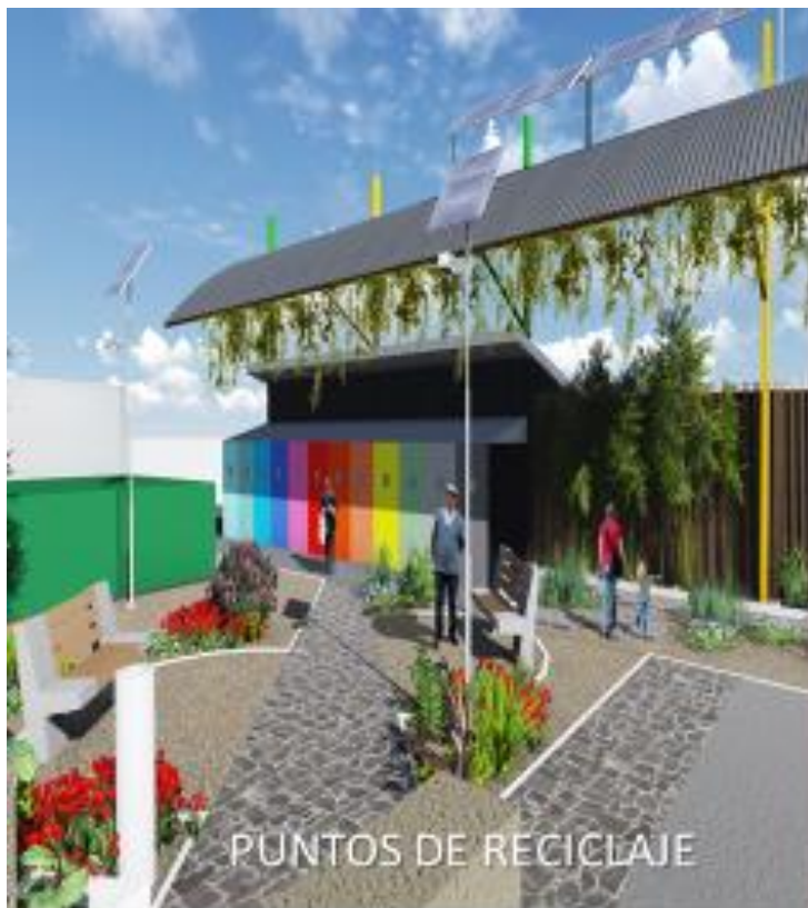
PUNTOS DE RECICLAJE