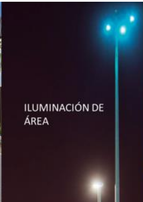
ILUMINACIÓN DE ÁREA